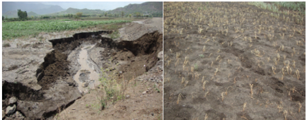
የአየር ንብረት ለውጥ የአፈር መከላከያን ያባባሳል፣ በሰብል ምርትና ምርታማነት ላይም ጫና ያደርጋል

ባለፉት ጥቂት አመታት በተከታታይ በተከሰተ የድርቅ፣ የውርጭ፣ የጎርፍና የሰብል በሽታ ምክንያት በመቁትና ራያ አዘዞ ወረዳዎች በሚገኙ ጥናቱ በተካሄደባቸው ቀበሌዎች ብዙ ቤተሰቦች ለምግብ ዋስትና እጦት ተጋልጠው ነበር። ለምሳሌ በመኸር 2002 ዓ.ም በድርቅ፣ በውርጭና በሰብል አጥፊ ተህዋስያንና ፍጥረታት ስብብ በመቁት ወረዳ ብቻ ከ41,000 በላይ ቤተሰቦች በምግብ ዋስትና እጦት ተጠቅተዋል። በመስክ ላይ በተሰበሰበው መረጃ መሠረት ወደ 80% የሚጠጉት ቤተሰቦች ከአየር ንብረት ለውጥ ጋር በተያያዘ በተከሰተ ተደጋጋሚ የተራዘመ የድርቅ አደጋ፣ ያልተጠበቀ የውርጭና የበረዶ ክስተት፣ ያልተጠበቀ የጎርፍ አደጋና የሰብል ተባይ ምክንያት የሰብል ምርትና የውሃ አቅርቦት ላይ ጫና ተፈጥሯል፣ የምግብ ዋስትና ችግርም ተባብሷል ብለዋል።