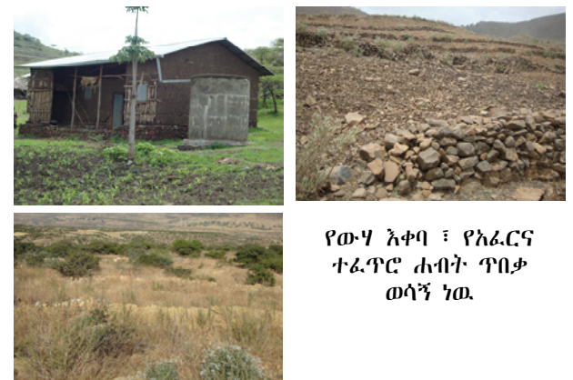
የውሃ እቀባ ፣ የአፈርና ተፈጥሮ ሐብት ጥበቃ ወሳኝ ነው

ይህ ጥናት በተካሄደባቸው የመቄትና የራያ አዘቦ የገጠር ቀበሌዎች የሚገኙ የህብረተሰብ ክፍሎች አካባቢያቸውንና ዋነኛ መተዳደሪያ የሆናቸውን የግብርና ሙያ በተመለከተ ለዘመናት የካበተ እውቀት፣ ልምድና ክህሎት ስላላቸው አስደናቂ ሊባሉ የሚችሉ የሰብል አመራረት፣ የእንስሳት አያያዝና የተፈጥሮ ሀብትና እንክብካቤ ዘዴዎችን በመጠቀም አስቸጋሪና ፈታኝ ከሆነው የመሬት አቀማመጥ፣ የተፈጥሮ ሀብትና የአየር ንብረት ሁኔታ የተሻለና የተረጋጋ ኑሮን ለመምራት ለዘመናት ጥረዋል። ከቅርብ ዓመታት ወዲህም ቢሆን የአየር ንብረት ለውጥ የሚፈጥራቸውን ተጨማሪ ስጋቶችና አደጋዎችን ለመቀነስና ተፅእኖዎቹን ለመቋቋም ተጨማሪና አዳዲስ ወይም የተሻሻሉ የሰብል አመራረት፣ የመስኖ አጠቃቀም፣ የአፈርና ውሃ አያያዝና አጠቃቀም፣ ጥምር የግብርና እና የደን ሀብት ልማት፣ የእንስሳት መኖ ልማትና አጠቃቀም፣ የእንስሳት ሀብት አረባብ ዘዴዎችንና ተጨማሪ ማህበራዊና ኢኮኖሚያዊ የችግር መቋቋሚያና የኑሮ መደገሚያ ዘዴዎችን ይጠቀማሉ። ይሁን እንጂ ከቅርብ ዓመታት ወዲህ የአየር ንብረት ለውጥ የሚፈጥራቸው አደጋዎችና ተፅእኖዎች እየበዙና እየተባባሱ በመምጣታቸው አብዛኛዎቹ ባህላዊ የችግር መቋቋሚያና ማስወገጃ ዘዴዎች እየተዳከሙ፣ የውጤታማነትና የዘላቂነት ደረጃቸውም አጠያያቂ እየሆነ መጥቷል። ሥለሆነም ህብረተ ሰቡ የአየር ንብረት ለውጥ ጋር ተጣጥሞ ለመኖር ከፍተኛ የሆነ የውጭ ድጋፍ ይሻል።