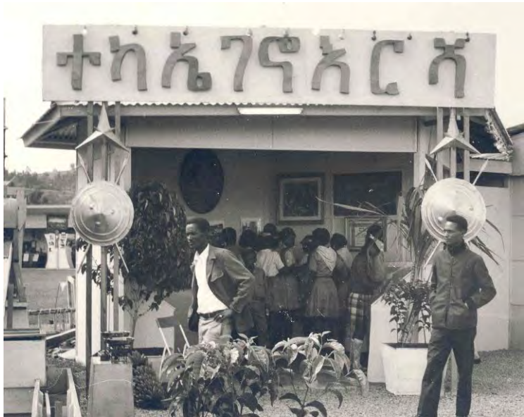
የቀኛዝማች ተካ ኤገኖ እርሻ በወጣቶች ሲገቡ