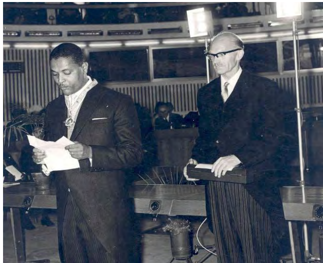
ቀኛዝማች ተካ የቀ.ኃ.ሥ. ሽልማትን በተቀበሉበት ወቅት

ቀኛዝማች በደንብ የተደራጀ የተሟላና የተቀላጠፈ አስተዳደር በመፍጠር ውጤታማ የእርሻ ድርጅት በማቋቋማቸው፤ በሌላ አነጋገር በምዕራብ ኢትዮጵያ ውስጥ በዘመናዊነት ወደር የሌለው ሜካናይዘድ የእርሻ ካምፓኒ በማቋቋማቸው የተነሳ በ1957 ዓ/ም በወቅቱ በአገሪቱ ከፍተኛ ክብርና ዝና የነበረውን የቀዳማዊ ኃይለ ሥላሴ ሽልማት ድርጅት በእርሻ ዘርፍ የወርቅ ሜዳልያ ለመሸለም በቅተዋል።